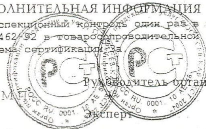
Схема сертификации за

Инспекционный контроль один раз в год. Маркировка продукции производится по ГОСТ Р 50462-92 в товаропроводительной документации.